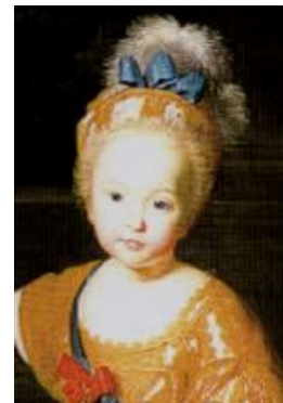
“El Infante don Felipe Pedro Gabriel de Borbón” 2 .