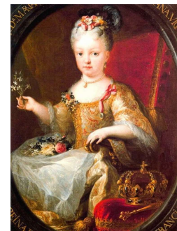
“Retrato de la Infanta Marian Victoria de España” 3 .