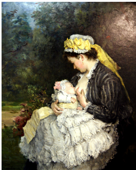
“La nodriza”, por BRETON DE LOS HERREROS.

Un ama de crianza, ama de leche o nodriza es una mujer que amamanta a un lactante que no es su hijo; su empleo se remonta a la prehistoria, y fue común hasta el siglo XIX para alimentar a niños cuyas madres no podían o no deseaban hacerlo.