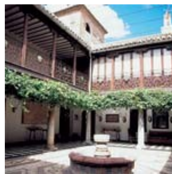
Fachada e Interior de la Casa de los Sánchez-Jijón, en la calle Jijones de Villarrubia de los Ojos.